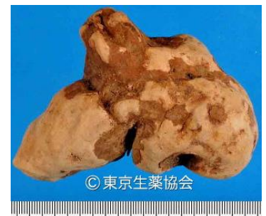
山帰来の全形生薬

南門から登ったところに展望台があり、美しい富士山を見ることができました。展望台で少し早い昼食をとりました。その後展望台からひかりの広場へ行きました。個人の庭に滝があったことに驚きました。国府橋(こうのばし)をわたり小滝(こゆるぎのたき)を見ながらもみじの広場に出ました。