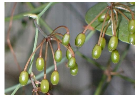
ケナシサルトリイバラの果実 サルトリイバラ科 (R4.6.3) 熟すと黒色になる