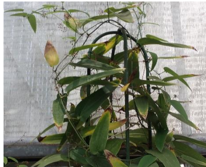
ケナシサルトリイバラ サルトリイバラ科 (R4.6.3) 東京都薬用植物園温室