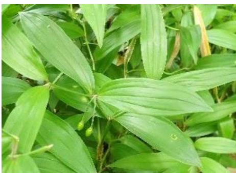
ホウチャクソウ ユリ目 イヌサフラン科

南門から登ったところに展望台があり、美しい富士山を見ることができました。展望台で少し早い昼食をとりました。その後展望台からひかりの広場へ行きました。個人の庭に滝があったことに驚きました。国府橋(こうのばし)をわたり小滝(こゆるぎのたき)を見ながらもみじの広場に出ました。