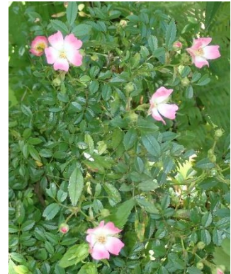
テリハノイバラ バラ目 バラ科

解散後に行った旧吉田茂邸はこれまた素晴らしく、敷地内にバラ園があり、吉田茂像(サンフランシスコに向かって立っている)があり(他にもいろいろ)に感動でした。吉田茂は、サンフランシスコ平和条約・日米安保条約を締結し、第2次世界大戦後の日本を形作った方ですから、展示物を見て歴史を感じました。旧吉田邸は、平成21年3月に原因不明の火災で母屋が消失したのだそうです。地元の大磯町や神奈川県によって再建されたそうです。