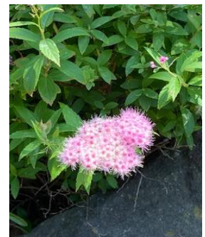
シモツケ バラ目 バラ科