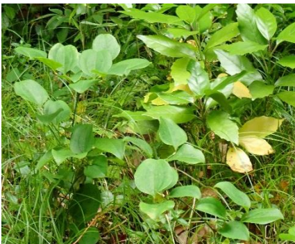
サルトリイバラ ユリ目 サルトリイバラ科