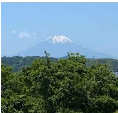
展望台から見た富士山

私は、植物を観ることが大好きで植物観察分科会の再開を心待ちにしていました。秋も開催できることを切望いたします。この日は、19名の参加者がありました。みなさま遠くまでお出かけいただきお疲れさまでした。植物観察会開催の為に下見へ行ったり資料を作成したり、準備をしてくださった先生方。本当にありがとうございました。