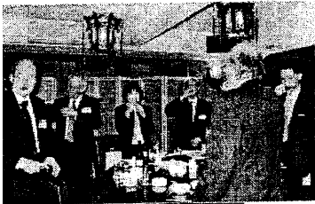
修了式の後、懇親会を開催

集合写真の高精細オンデマンドプリント版をご用意しております。 日漢協漢方総合講座(第23回)修了の記念に如何でしょうか。